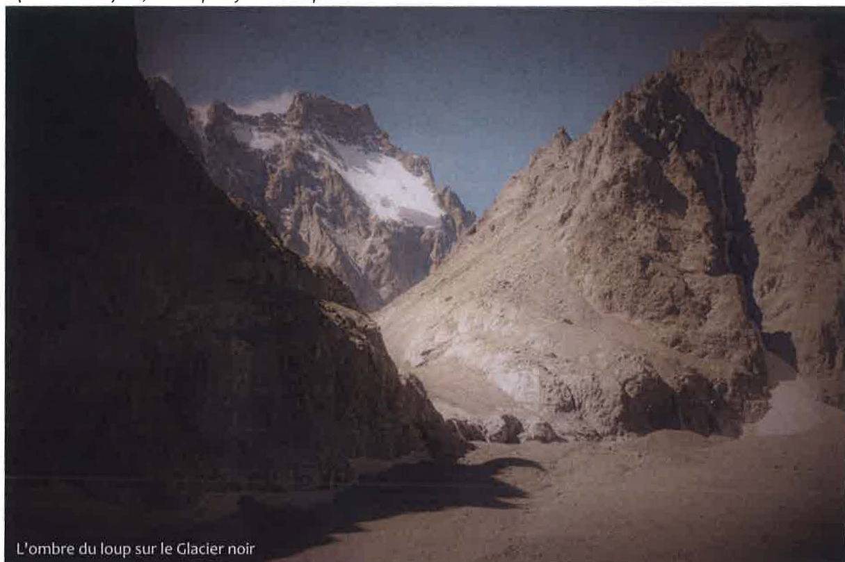
L'ombre du loup sur le Glacier noir

Quand c'est flou, c'est qu'il y a un loup !