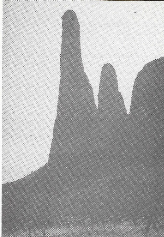
Le Kaga Tondo éperon nord 600 m

répétant la voie espagnole au Suri Tondo, l'éperon nord du Wanderdu, et enfin réussissant, avec un bivouac sous le sommet, la deuxième ascension des 600 mètres de l'éperon nord du Kaga Tondo, ce fantastique obélisque. Il a fallu grimper avec les bidons d'eau sur le dos, et malgré l'exposition nord de la voie, le retour du deuxième jour avec ses 7 ou 8 rappels nous laisse assez épuisés par la soif, puis, paradoxalement, après les 35° à l'ombre, par le froid qu'amène un fort vent de sable. Une grande virée de quelques jours pour aller voir le Niger et Gao nous remet sur pieds et nous avons le temps d'ouvrir une belle voie dans une tour détachée du plateau de Koyo.